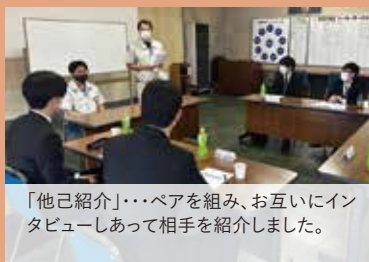
「他己紹介」・・・ペアを組み、お互いにインタビューしあって相手を紹介しました。