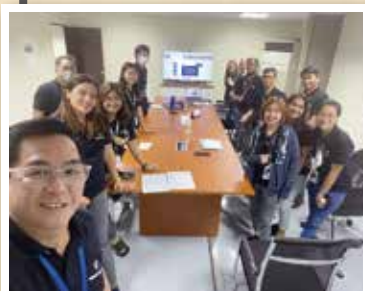
撮影時のみマスクをはずしています

ISO 認証監査は 9 月 9 日 (金)、26 日 (月) の 2 日間行われ、2 日目は台風の影響によりリモートでの実施となりました。