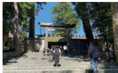
伊勢神宮正宮(内宮)

最後にスポーツ、行楽の良い季節になりました。注意を払いながらになりますが、短い秋を大いに楽しみたいものです。