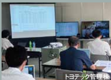
トヨテック管理棟

豊川地区の一部出席者はトヨテック管理棟から、また大分、中国、フィリピンの各工場はオンラインで参加し、ハイブリット形式での開催となりました。