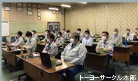
トーヨーサークル本部