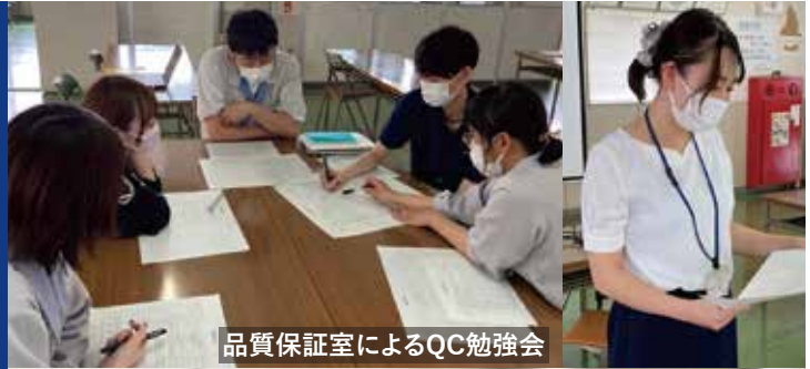
品質保証室によるQC勉強会