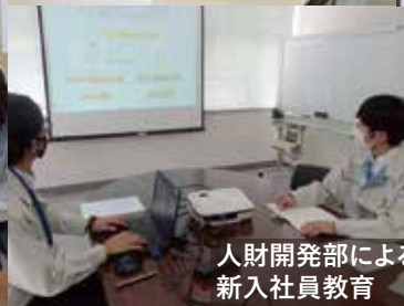
人財開発部による 新入社員教育