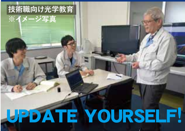
技術職向け光学教育 ※イメージ写真