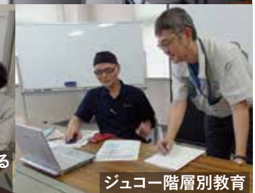
ジュコー階層別教育