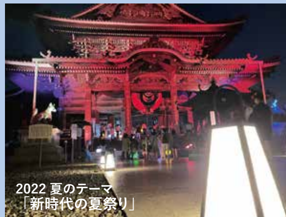
2022 夏のテーマ 「新時代の夏祭り」

本イベントにはトヨタテックが協賛し、特典として頂いた無料チケットについては希望する社員に配布されました。