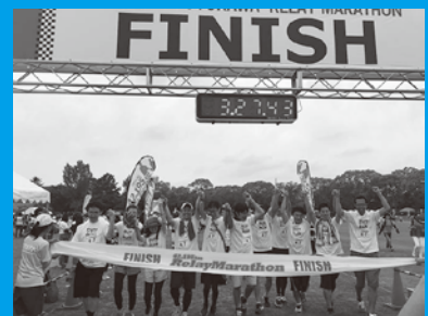
チーム全員でゴール(2019年)